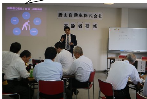
座学による研修風景