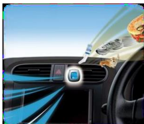
『ファブリーズ クルマ イージークリップ』使用イメージ

「ファブリーズ クルマ イージークリップ」は、P&G のエアケアブランド「ファブリーズ」の車専用消臭芳香剤です。エアコンの送風口にセットすることで、車内のニオイの原因となる食べ物や、汗などの体臭、ペットやエアコン、タバコのニオイなどをしっかり消臭し、車内の快適空間を実現します。ワンタッチで簡単にセットでき、約30日間香りが継続するので、手軽に使えるのも特長のひとつです。好みに合わせて選べる香りの種類は10種類以上、香りの強さ調節ダイヤルつき。自宅の車でのドライブ時のニオイ対策にもおすすめです。